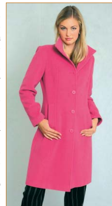
ОАО «Швейная фабрика им. Тинякова» стала партнером УПЭК в 2000 году.

Среди новейших — открытие стогового магазина. Сюда попадают вещи после двух-трех уценочек в фирменном магазине. Планируется,